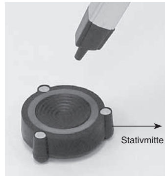
Abbildung 2a. Legen Sie die Unterlage so unter das Stativbein, dass ein „Fuß“ in Richtung Stativmitte zeigt.

Außergewöhnliche optische Produkte für Endverbraucher seit 1975