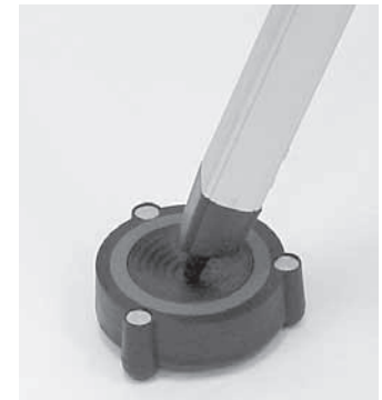
Abbildung 2b. Stellen Sie sicher, dass das Stativbein jeweils genau auf der Mitte der Unterlage steht.

Ihr Teleskop in Schwingung versetzt wird, das viskoelastische Material nimmt diese auf und wandelt sie in eine kleine Menge Wärmeenergie um. So können sie nicht vom Boden reflektiert und erneut auf das Stativbein übertragen werden. Wenn Vibrationen in der Nähe des Teleskops auf dem Boden auftreten, gelangen diese gar nicht erst bis zum Stativbein. Daraus ergibt sich eine deutliche Verringerung der Vibrationsdauer.